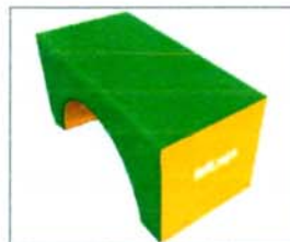
Réf. 0343 HANDI SUPPORT L'unité. 50 x 100 x 50 (Lxlxh).