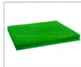
Réf. 0344 HANDI SOFT MAT 170 x 100 x 10 cm (Lxlxh).