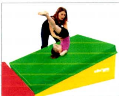
EXEMPLE D'EXERCICE POSSIBLE AVEC LE MODULE PAN COUPÉ RÉF. 0342 ET LE HANDI SOFT MAT RÉF. 0344