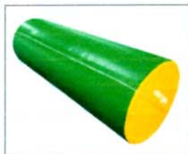
Réf. 0340 HANDI CYLINDRE 200 x 70 cm (LxØ).

Les modules Handi pan-coupé et Handi support sont réalisés en mousse haute densité pour plus de soutien et les modules Handi cylindre et Handi escalier en mousse polyester pour plus de légèreté. Les dimensions et les type de mousse utilisés ont été spécialement étudiés pour convenir parfaitement aux enfants mais également aux adultes. Housse en PVC 1000 deniers classée au feu M2. Dessous antidérapant.