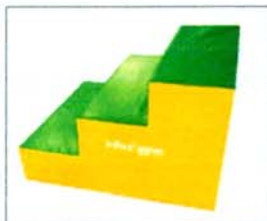
Réf. 0341 HANDI ESCALIER 114 x 100 x 72 cm (Lxlxh). 4 poignées de portage.