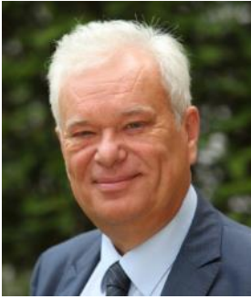
Patrick Septiers Président du Département de Seine-et-Marne

Premier partenaire du sport en Seine-et-Marne, avec un budget de 5 millions d'euros consacré aux sports, aux loisirs et à la jeunesse, le Département accompagne l'ensemble du mouvement sportif et entend plus que jamais se positionner comme son porte-parole, dans un contexte national de réduction brutale des budgets.